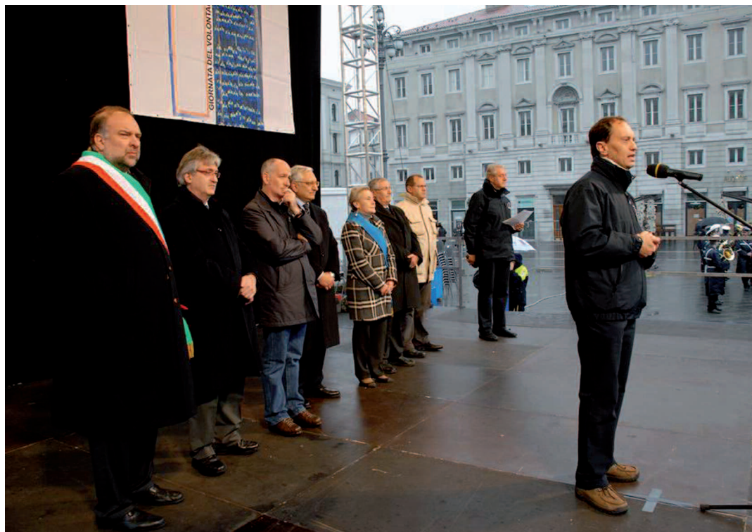
L'intervento dell'assessore regionale Luca Ciriani