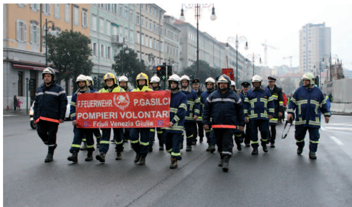
Immagini della sfilata dei 2.500 volontari presenti alla manifestazione